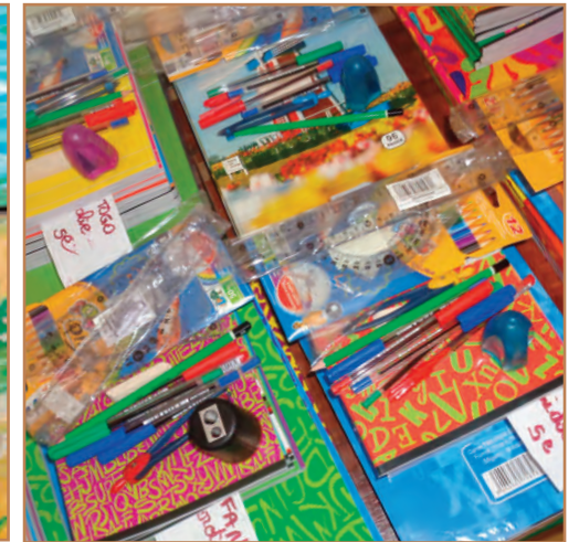
Préparation des fournitures par élève.