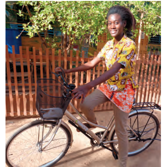
Moyen de transport