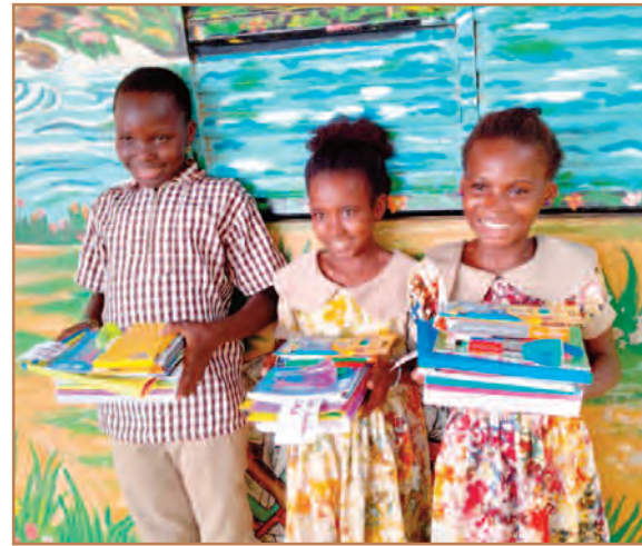
Les élèves de CM1.