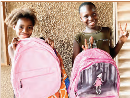
Distribution de cartables en cours d'année.