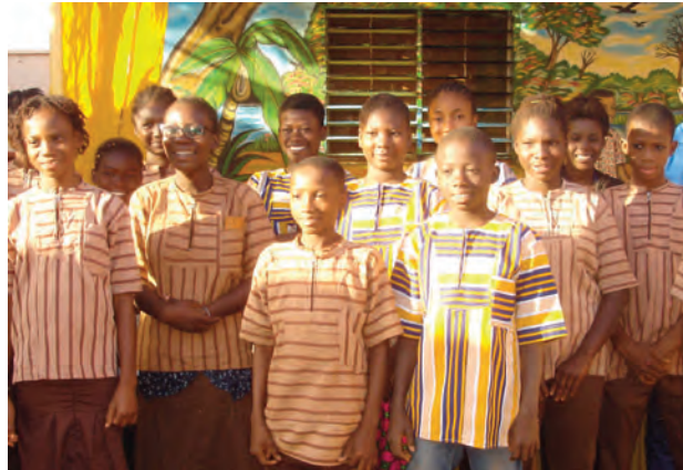
Deux tenues scolaires