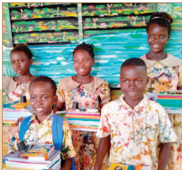
Les nouveaux collégiens le jour des distributions de fournitures scolaires.

En secondaire 25 élèves suivent le cursus général ou le lycée technique, 2 élèves ont démarré une formation, 4 sont en apprentissage et 5 étudiants sont en études supérieures.