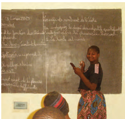
Cours de soutien scolaire