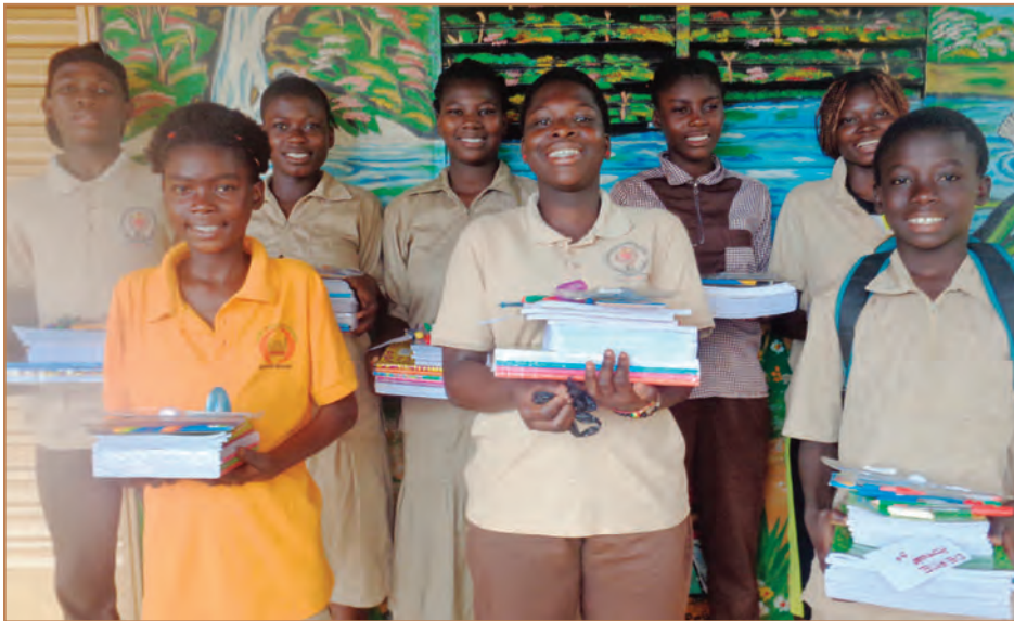
Les élèves de 5ème et 4ème.