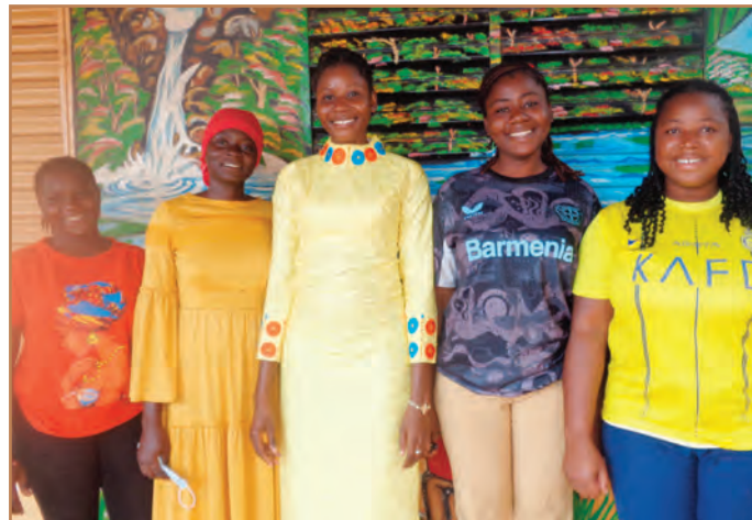
Les étudiantes sont venues aider le jour de la distribution.