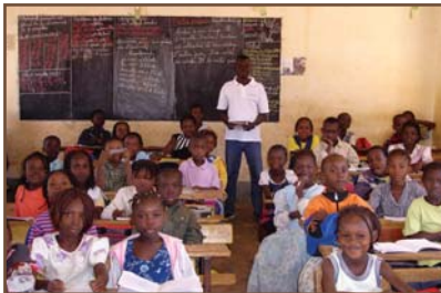
La classe de CP2.