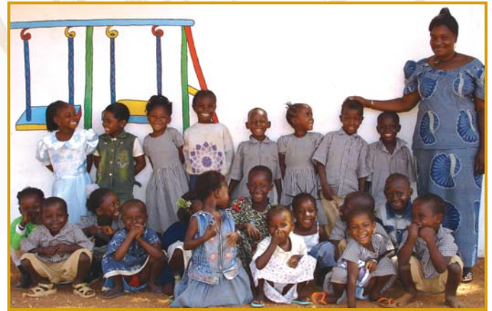
Les maternelles et leur directrice.

En dehors de ces parrainages, 9 enfants du quartier ont pu être aidés par l'association pour leurs livres et fournitures.